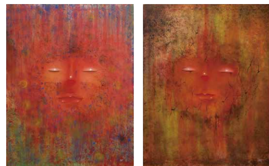
▲ 会員賞 青生 支配(絵画/F30号) | 汚染(絵画/F30号)