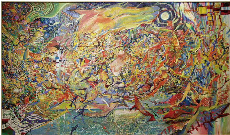
▲ ZERO会会長賞 横田真吾 千の風になって(絵画/4668x2736mm)