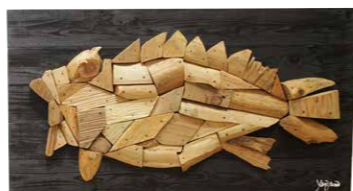
▲ 兵庫県知事賞 八木正宏 カサゴ(木工/1100x580x60mm)