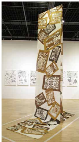
▲ 新人大賞 塩治清美 大阪かるた「散」(染織/13000mm)