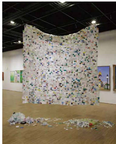
▲ 兵庫県教育委員会賞 nagata yura cleaning(インスタレーション/2700x2700mm)