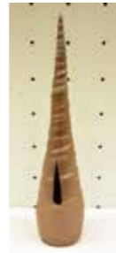
▲ 馬場章太「境界I」(120x120x500mm) 堺市長賞