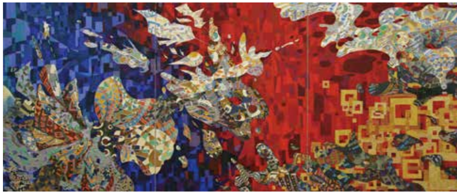
▲ 吉田絵美「変化する中心」(3900x1620mm) 2020・ZERO展大賞