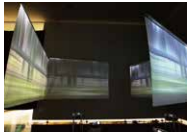
▲ Palla/河原和彦「City Scope」(映像) 大阪府知事賞