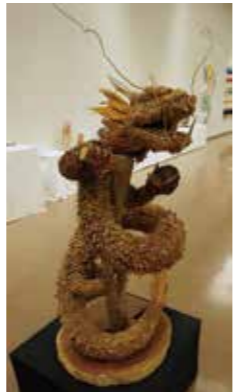
▲ 木村公志「龍」(600x600x1200mm) 新人賞