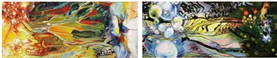
▲ 泉川博之「2020 最高の気分I」「2020 最高の気分II」(各3900x1620mm) 松井正賞