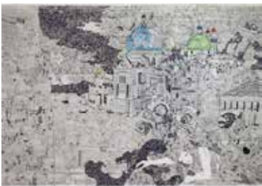
▲ 中野真希「Landscape」(3152x2182mm) 塚本学院校友会会長賞