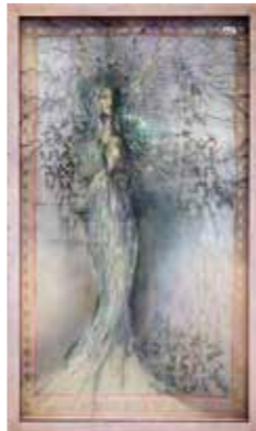
▲ 山本大平「X」(910x1820x100mm) 大阪市長賞