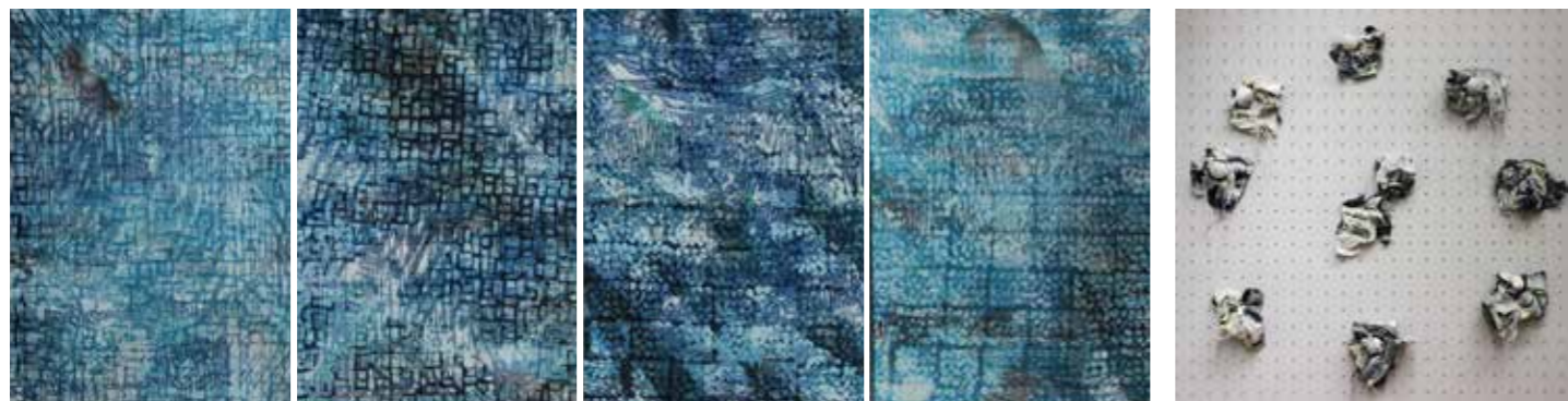
▲河合美幸「Blue blue Blue」(ZERO展大賞) ※染織